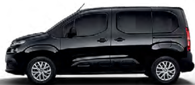
ČIERNÁ PERLA NERA (M)