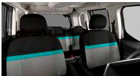
LÁTKA METROPOLITAN GREY (OFFT)