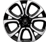
DISK Z ĽAHKEJ ZLIATINY 17" SPIN