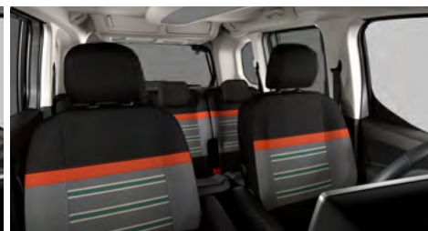
PACK XTR S POŤAHOM WILD GREEN (OGFR)