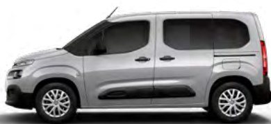
SIVÁ ARTENSE (M)