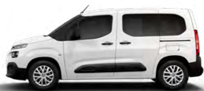
BIELA BANQUISE (N)