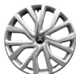
OZDOBNÝ KRYT 16" TWIRL (s čiernym stredom)