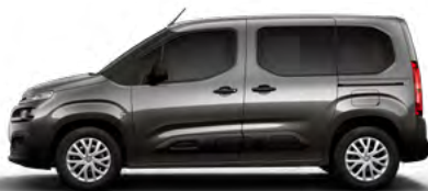
SIVÁ PLATINUM (M)