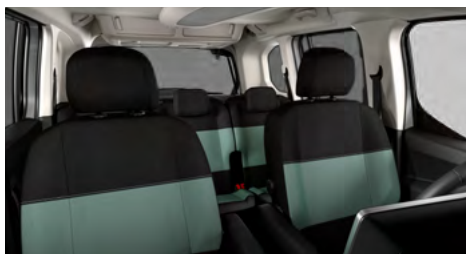
LÁTKA MICA GREEN