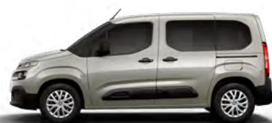
BÉŽOVÁ SABLE (M) (Nie je možné objednať pre LIVE PACK)