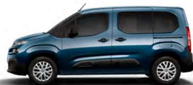
MODRÁ NUIT (M) (Nie je možné objednať pre LIVE PACK)