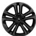
DISK Z ĽAHKEJ ZLIATINY 16" STARLIT