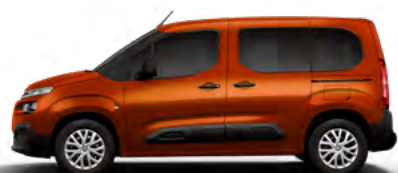
HNEDÁ CUPRITE (M) (Nie je možné objednať pre LIVE PACK)

M – metalická farba; N – nemetalická farba