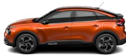
HNEDÁ CAMEL (M)