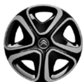
OKRASNÝ KRYT 16" 3D STEEL & STYLE