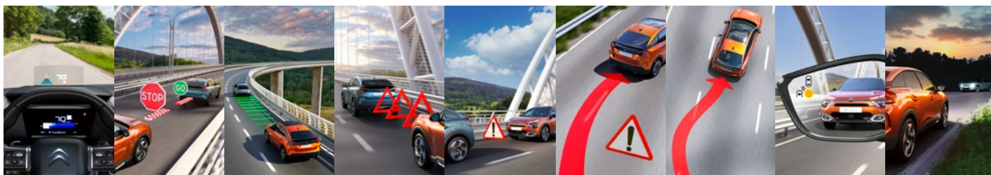
FAREBNÝ HEAD-UP DISPLEJ