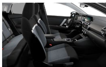
ŠTANDARDNÝ INTERIÉR (PRE LIVE PACK A FEEL)