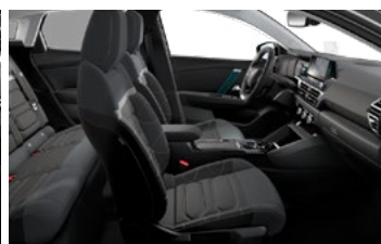
INTERIÉR METROPOLITAN GREY (V SÉRII PRE SHINE)