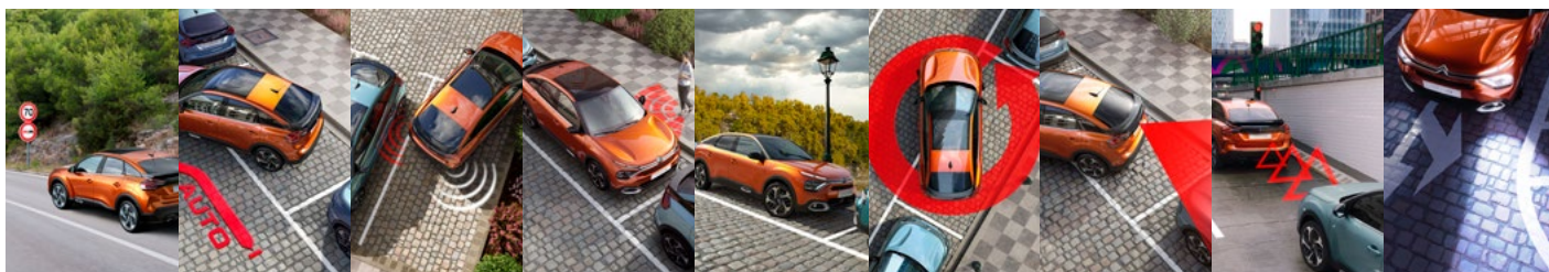
ČÍTANIE DOPRAVNÝCH ZNACIEK A RÝCHLOSTNÝCH OBMEDZENÍ