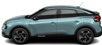
MODRÁ ICELAND (M)