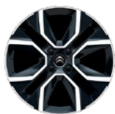
DISK Z LAHKEJ ZLIATINY 18" HANOY