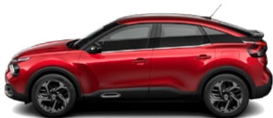
ČERVENÁ ELIXIR (P)

(M) – metalická farba karosérie, (P) – perleťová farba