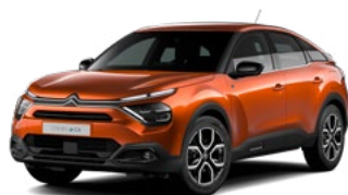
PACK COLOR GLOSSY BLACK