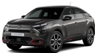
PACK COLOR ANODISED RED