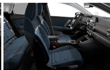
INTERIÉR METROPOLITAN BLUE