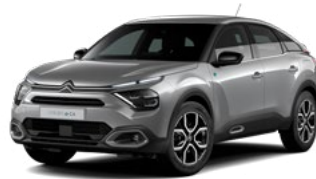
PACK COLOR TEXTURED GREY