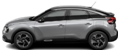
SIVÁ ARTENSE (M)