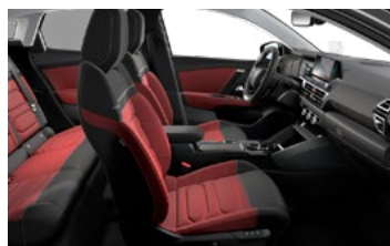
INTERIÉR HYPE RED