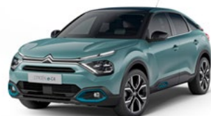
PACK COLOR ANODISED BLUE