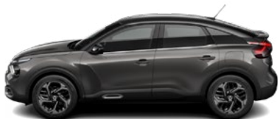
SIVÁ PLATINIUM (M)