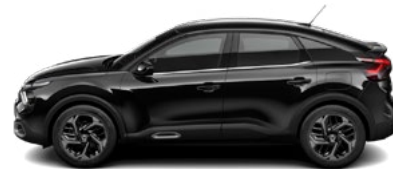
ČIERNÁ OBSIDIEN (M)