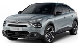
PACK COLOR VAPOR GREY