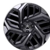
DISK Z LAHKEJ ZLIATINY 18" CAMELIA