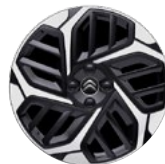
DISK Z LAHKEJ ZLIATINY 18" CAMELIA DIAMANTÉE