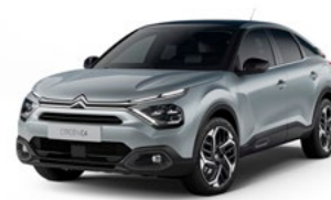
PACK COLOR VAPOR GREY