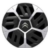
OKRASNÝ KRYT 18" AEROTHECH