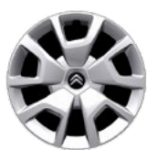
OKRASNÝ KRYT 16" SPRING